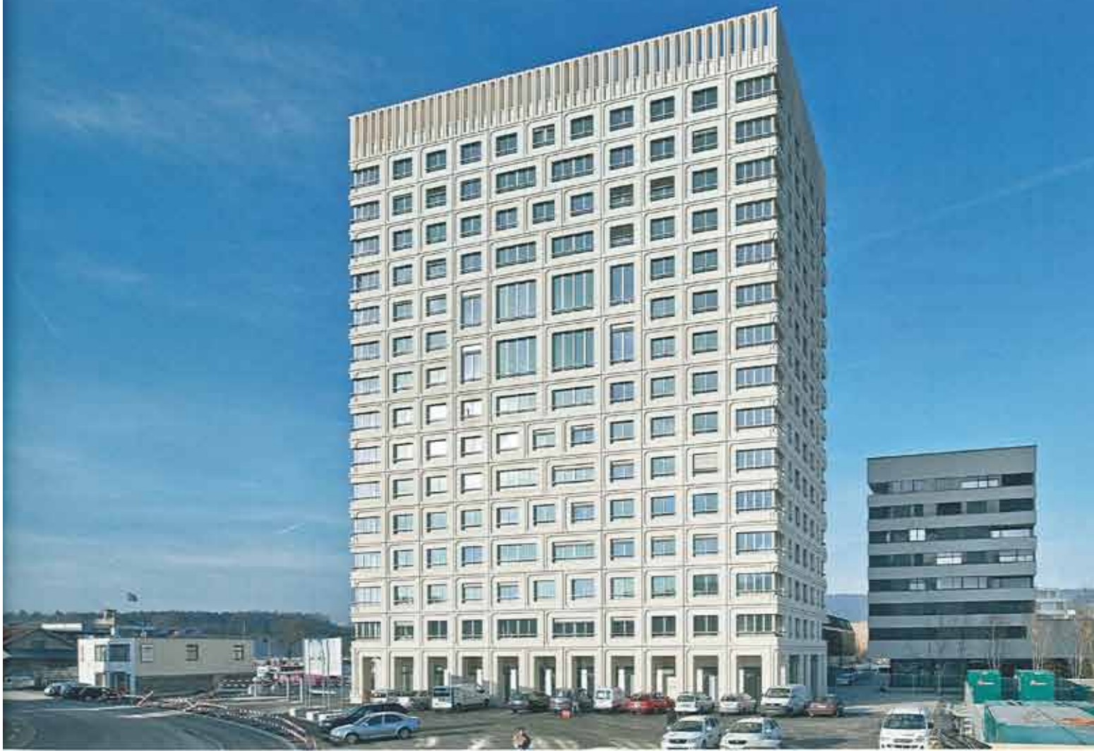
Das Wohnhochhaus auf dem Areal am Rietpark in Schlieren: Die als überdimensionierte Steine interpretierten Rahmen wirken zusammen mit der geschossweisen Verschiebung wie ein »Mauerwerksverband«. Der untere und der obere Abschluss akzentuieren durch Auflösung respektive Drehung der Rahmen ausdrucksstark Sockel und Dachrand.